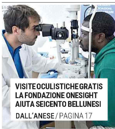
VISITE OCULISTICHE GRATIS LA FONDAZIONE ONESIGHT AIUTA SEICENTO BELLUNESI DALL'ANESE / PAGINA 17

I tavoli si apriranno a breve con un obiettivo chiaro: entro gennaio individuare lo stabilimento pilota che sperimenterà la settimana corta. È il cuore dell'accordo programmatico firmato da EssilorLuxottica con Filctem Cgil, Femca Cisl e Uiltec Uil, che nelle prossime settimane entrerà nel dettaglio operativo. Dal primo gennaio 2026, il modello delle settimane corte - 20 giornate di riposo aggiuntive all'anno a parità di stipendio - sarà esteso per la prima volta a un intero sito produttivo. PAOLINI / PAGINA 14