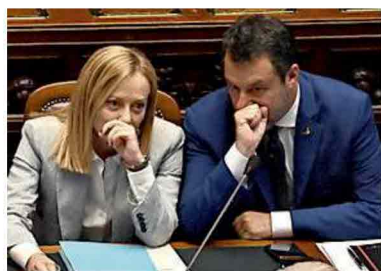
Giorgia Meloni e Matteo Salvini